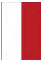
1/2 página alto Half page vertical 100mm x 295mm (+ 3mm Bleed)