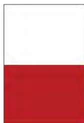
1/2 página baixo Half page horizontal 200mm x 147mm (+ 3mm Bleed)