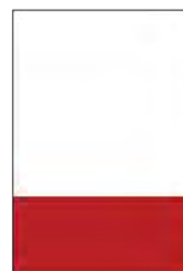
1/3 página baixo 1/3 page horizontal 200mm x 105mm (+ 3mm Bleed)