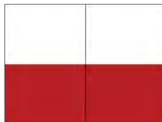
1/2 página dupla Half double page 400mm x 147mm (+ 3mm Bleed)