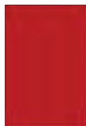
Página Full page 200mm x 295mm (+ 3mm Bleed)