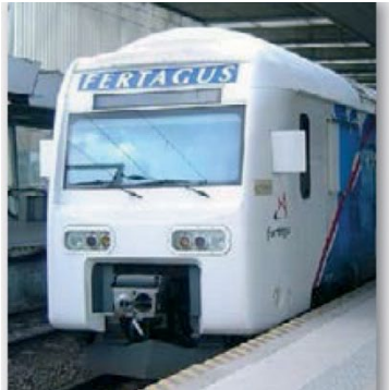
TRANSPORTES PÚBLICOS PUBLIC TRANSPORT