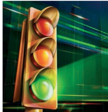
SEMÁFOROS TRAFFIC LIGHTS