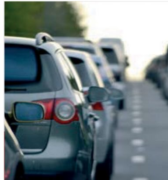
PRINCIPAIS RUAS E AVENIDAS MAIN STREETS AND AVENUES