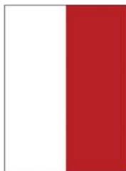
1/2 página alto Half page vertical 102mm x 275mm (+ 3mm Bleed)