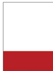
1/3 página baixo 1/3 page horizontal 205mm x 91mm (+ 3mm Bleed)