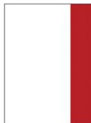
1/3 página alto 1/3 page vertical 72mm x 275mm (+ 3mm Bleed)