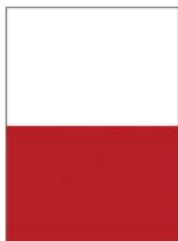
1/2 página baixo Half page horizontal 205mm x 137mm (+ 3mm Bleed)